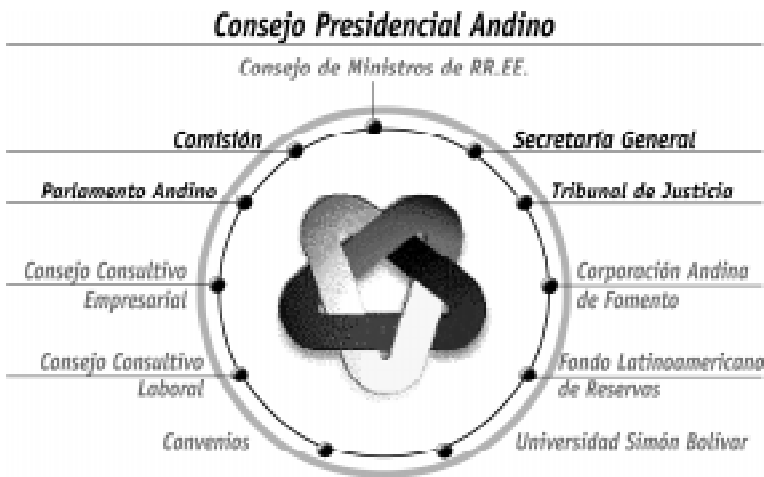
Gráfico 1 Instituciones del Sistema Andino de Integración

Por todo lo dicho, la Comunidad Andina está integrada actualmente por Bolivia, Colombia, Ecuador, Perú y Venezuela, y por los órganos e instituciones del Sistema Andino de Integración.