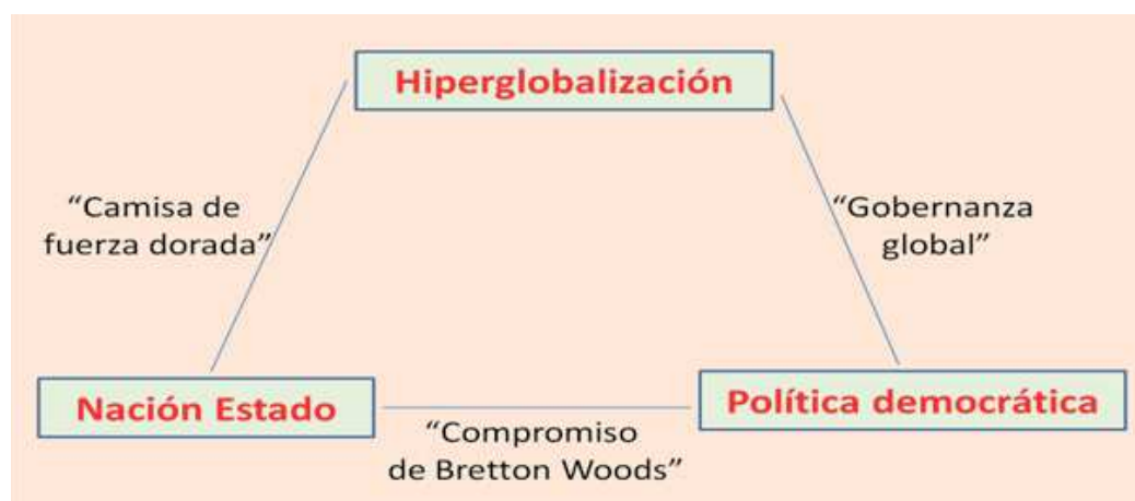
FIGURA 3. El trilema de la hiperglobalización de Dani Rodrik

Quizás ha sido Dani Rodrik, una referencia fundamental en el análisis del comercio internacional y su impacto en el desarrollo, quien ha explicado mejor la naturaleza de la crisis con su –ya clásico– gráfico sobre el trilema de la globalización.