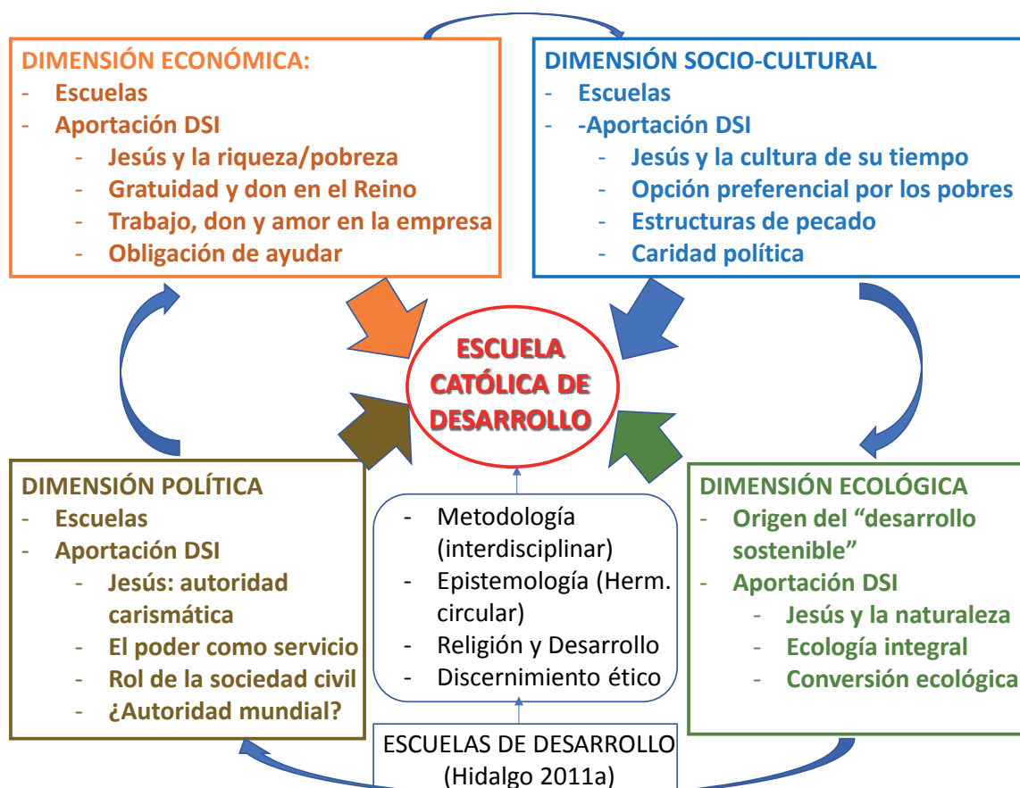
FIGURA 3. Aportaciones diferenciales de la DSI a las dimensiones del desarrollo